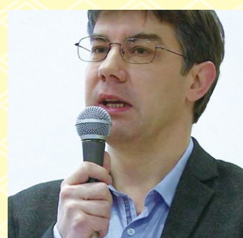
パトリック・ルーカス教授