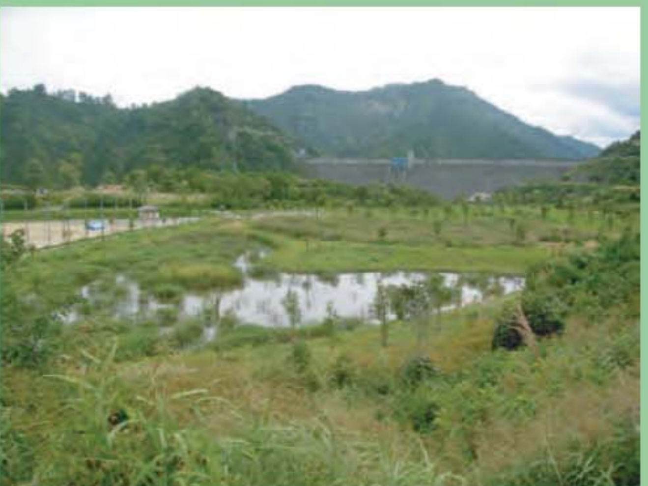
緑ゆたかなエコパーク

ここはもともと湿地があり、特有のトンボや植物が生育していた場所です。平成11年～15年に発電所建設時の土捨て場として使われましたが、様々な工夫によってこれら動植物を絶やすことなく、工事後に湿地を再現しました。遊歩道がついていて一般に開放されています。春には、ミズバショウやリュウキンカ、ミツガシワなどの水生植物が花を咲かせます。初夏から秋になると、様々なトンボが出現し、モリアオガエルが産卵をはじめます。懸命に生きるこれらの動植物を大切に、静かに見守ってゆきましょう。