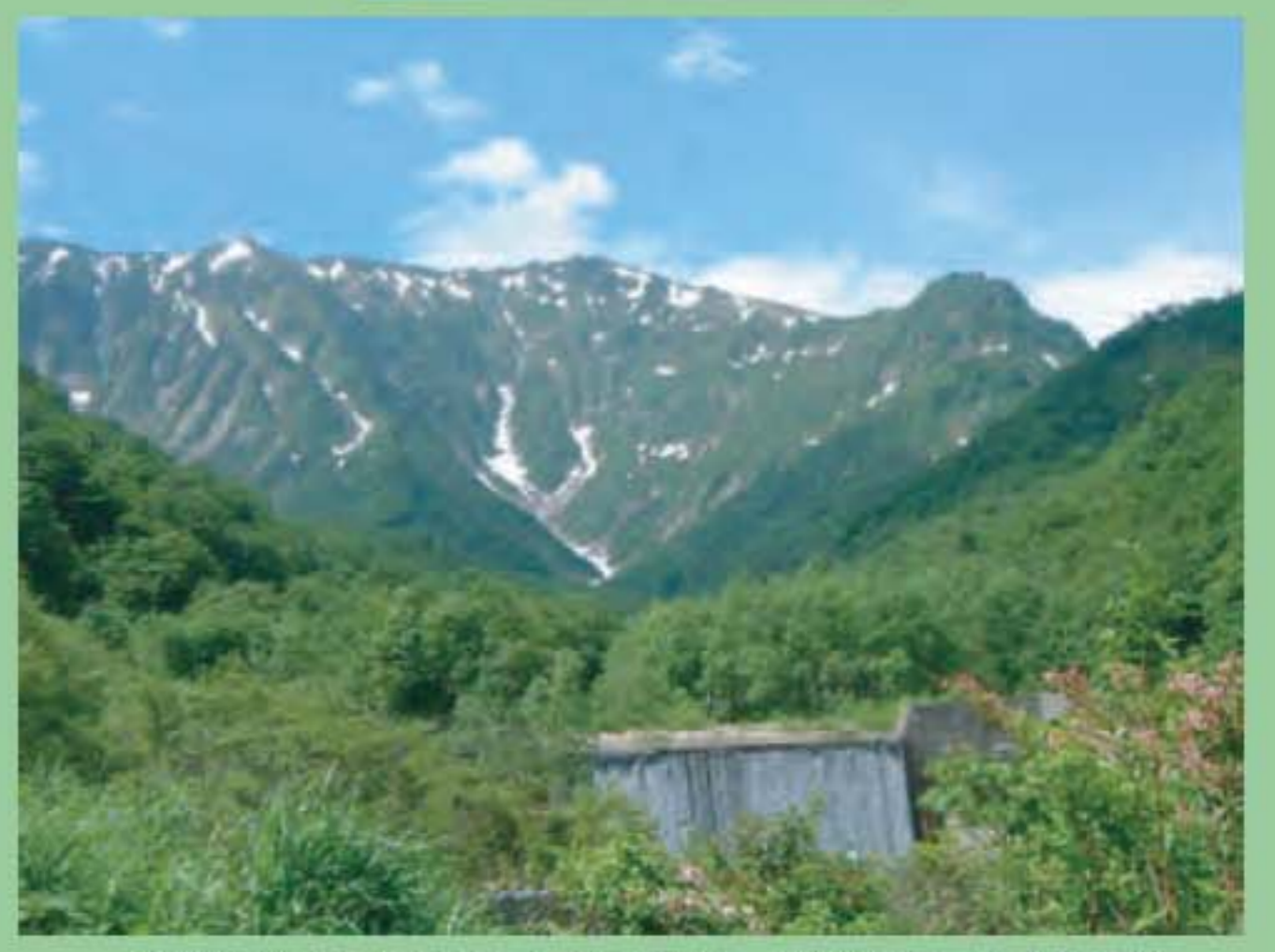
中荒沢からの荒沢岳

越後の穂高岳と称される、険しく雄大な山です。岩場が連続するため、登山には細心の注意が必要です。銀山平の登山口から往復約8時間の登山コースです。