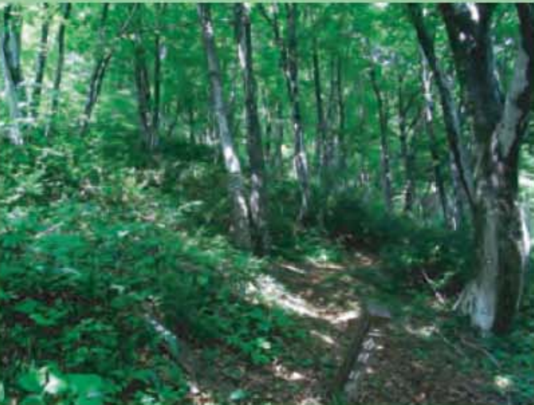
駒ノ湯側のルートはブナ林が美しい

かつては銀山と越後側の麓の集落を結んだ唯一の道で、銀の採掘時代には行きかう人が絶えませんでした。今はブナに囲まれたひっそりとした山道で、ハイキング道として整備されています。一合ごとに地名の入った標柱が立っていて、当時の様子を偲ぶことができます。