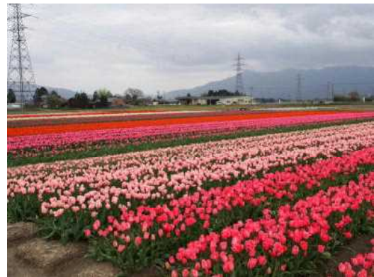
【五泉市のチューリップまつりの会場】

出典：「H29年市区町村別面積調」(国土地理院)、 H29年県統計課の推計人口(10月1日現在)