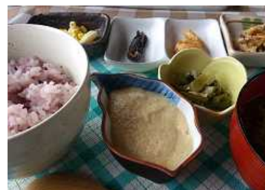
地域特産の自然薯を活用したメニュー